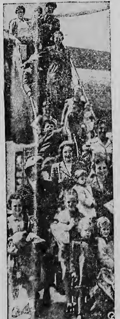
DE UITTOCHT van Britse vrouwen en kinderen uit Cairo is begonnen. Elk vliegtuig met het Midde-Oosten brengt een grote stroom van Britse „vluchtelingen“. Intussen is de Regering van Naguib weer versterkt door de pro-Egyptische uitlatingen van Foster Dulles.

LAS VEGAS. - De elfde en laatste atoomontploffing van de serie van voorjaarsproefnemingen is vanmorgen kort voor het aanbreeken van de dag geschied. Een romantische Reuter-reporter seint dat de paddestofdovormige stofwolk prachtig afstak tegen het doorbrekende daglicht.